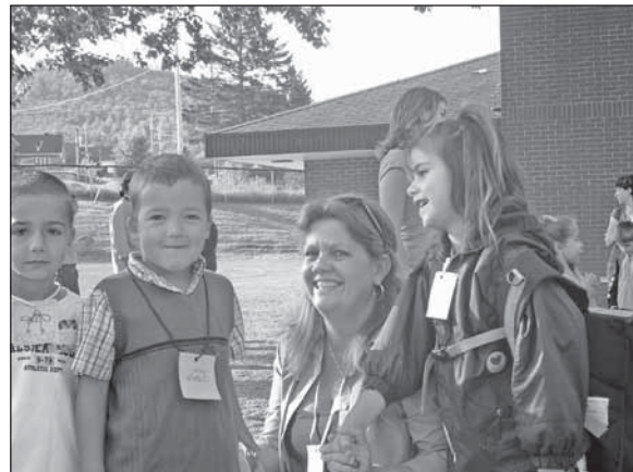
La joie de la rentrée

Toutefois, malgré cette exubérance propre à la jeunesse, bien des nouveaux demeuraient serrés contre papa ou maman, intimidés par tout cet inconnu et cette nouveauté. Les habitués de l'année précédente recherchaient la couleur des cartons que chaque jeune portait à son cou afin de repérer les copains de l'année précédente qui occuperaient le même local qu'eux ou encore le professeur qui serait le leur pour toute cette nouvelle année scolaire.