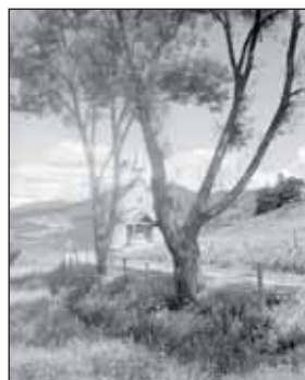
Chapelle du village de Tewkesbury, 1948.

Hélène Michaud, consultante Courriel : hmichaud@phar.ca Téléphone : (418) 948-6727