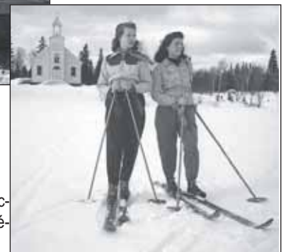
Skieuses et chapelle de Lac-Beauport, 1942