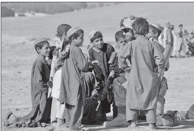
Enfants afghans, photo prise par Chantale Parent

La couverture que le journal Le Lavalois veut donner sur nos militaires en est une d'information et de support pour nos concitoyens en mission et non une de politique. Nous soulignons l'engagement et la générosité de ces femmes et de ces hommes qui choisissent de risquer leur vie pour que des enfants aient des écoles, que des femmes trouvent la sécurité et que le pays dispose d'infrastructures qui permettent aux afghans de jouir d'une vie meilleure. Au-delà des morts qui nous affligent, nous souhaitons que leur sacrifice laisse la place à un monde meilleur dans un pays où la précarité, la misère et l'intégrisme sévissent.