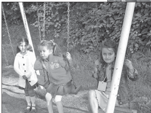
L'envol vers les sommets

Cependant, toutes et tous attendaient l'heure de l'accueil officiel. À 8 h 30, les élèves étaient regroupés avec leur titulaire dans le gymnase. Assis sur des tatamis bleus, ils regardaient avec curiosité l'immense toile illustrée qu'on avait tendue devant un mur