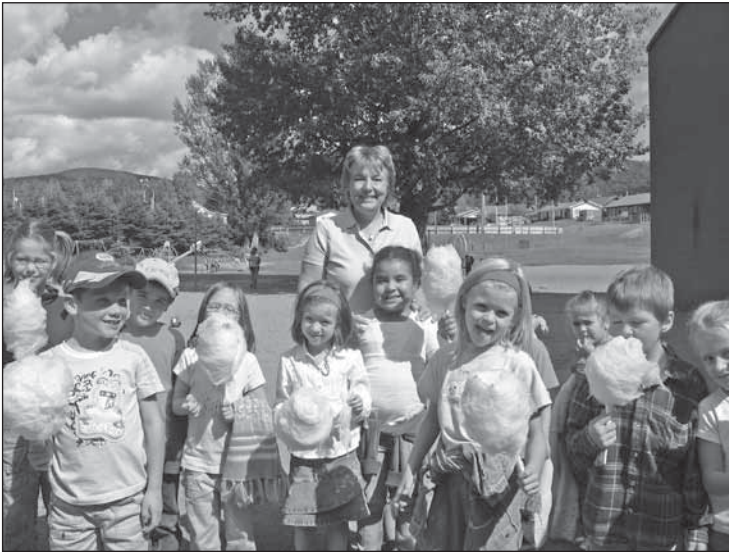
Miam, Miam, c'est bon la barbe à papa!