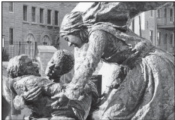
L'oeuvre de l'artiste Truong Chanh Trung intitulée COMPASSION

Gens de Québec, vous êtes déjà à la recherche de façons d'honorer sa mémoire. J'aimerais vous faire part de ce que je pense qu'elle aimerait... et qui plairait aux citoyens; sur le bord du fleuve, à la hauteur de la Plage Jacques-Cartier, une sculpture la représentant assise sur un banc public, avec assez de place sur