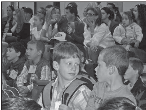
Rassemblés au gymnase