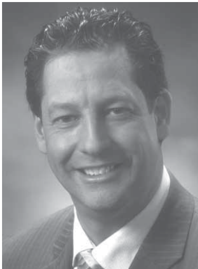
Hubert Benoit, Député de Montmorency