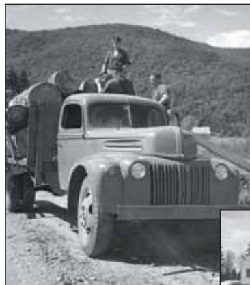
Chargement de billots de merisier à Tewkesbury, 1944.