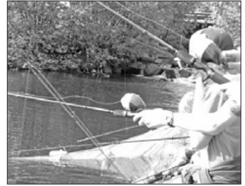
Cannes à l'oeuvre

Pour terminer l'année en beauté, tous les écoliers, leurs parents, l'OPP et le personnel de l'école Du Trivent ont été invités à se rendre au gymnase le 19 juin pour assister à un spectacle où musique et théâtre étaient à l'honneur.