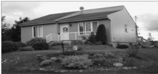
14 rue St-Paul