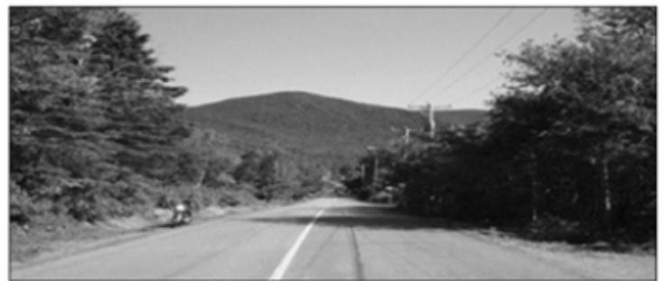
962 Ave Ste-Brigitte