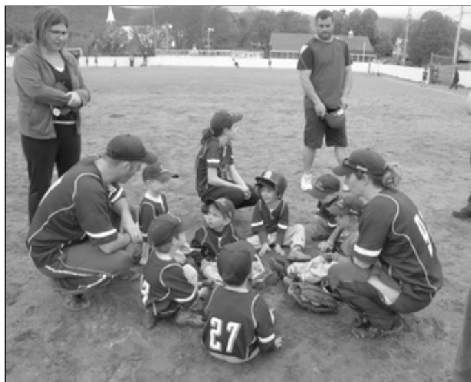
Les jeunes pré-novices ont eu la piqûre

Caprice de dame nature? Un été frais? De la pluie plus que les autres années? Certainement pas sur le terrain de baseball de Sainte-Brigitte où nos pré-novices (les équipes Bibittes et Fourmis) et novices (les équipes Tornades et Tonnerres) ont pratiqué et joué au baseball tout l'été. Chaque samedi matin, nos jeunes sont venus s'amuser, toujours avec la bonne humeur et le goût d'apprendre les bases d'un beau sport comme le baseball.