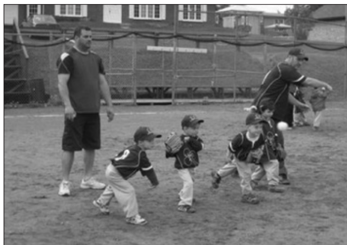
S'amuser tout en apprenant, une bonne philosophie

Pour débiter avec nos jeunes de 4-5 ans, plusieurs d'entre eux en étaient à leurs premières expériences. Ces jeunes énergiques ont tout de suite eu la piqûre. Avec des lancers de «ballounes d'eau» sur les parents et entraîneurs, on est certain d'apprendre à lancer de toutes ses forces! L'idée de s'amuser tout en apprenant est la philosophie des entraîneurs. Même que certains jeunes se sont permis de frapper la balle venant du lanceur à 35 – 40mph. BRAVO !. Un belle progression. Chapeau à tous nos pré-novices !