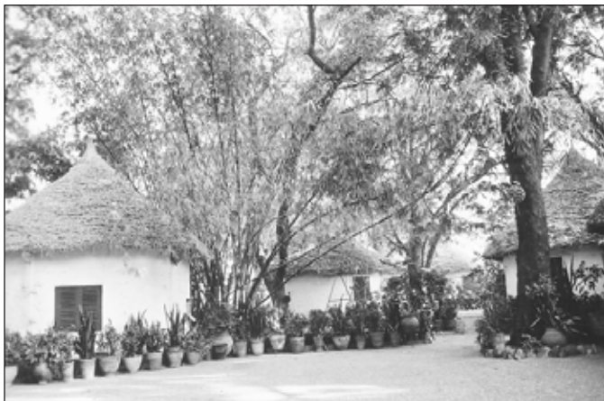
Hôtel Mayo à Maroua