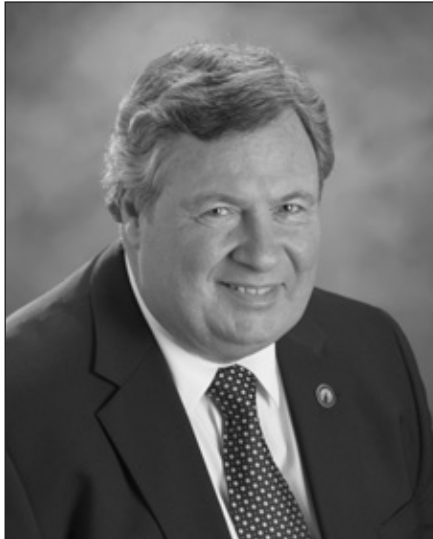
Raymond Bernier Député de Montmorency