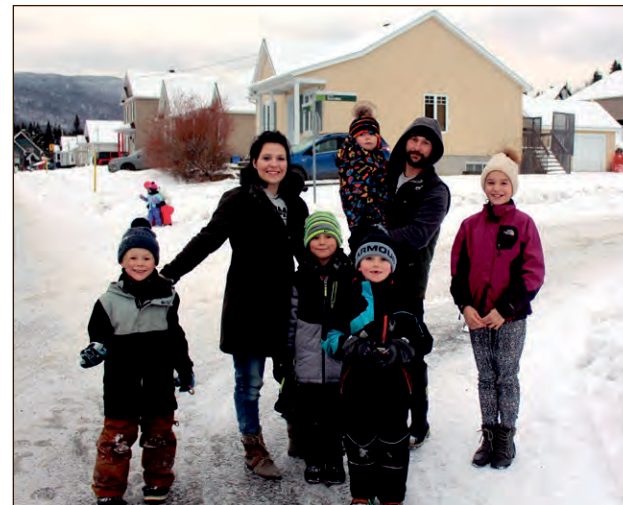
Des gamins heureux dans plusieurs quartiers