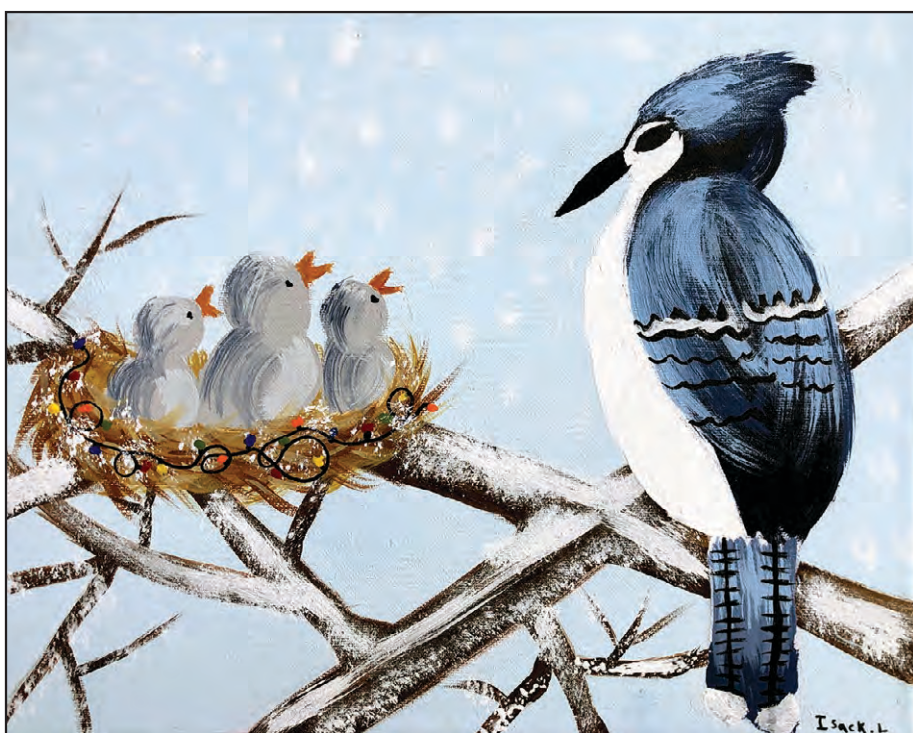
« Geai bleu », acrylique sur toile