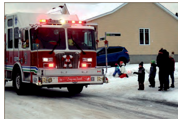
Un camion de pompiers, c'est toujours impressionnant pour les petits et même pour les grands.