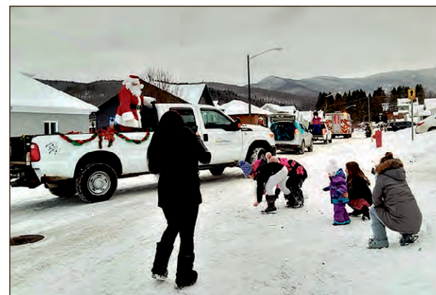
Un Père Noël heureux, des enfants ravis malgré le froid et un défilé qui a illuminé les yeux de tous.