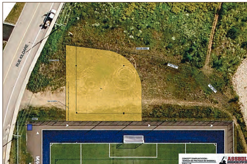
Une vue du futur terrain de pratique de baseball